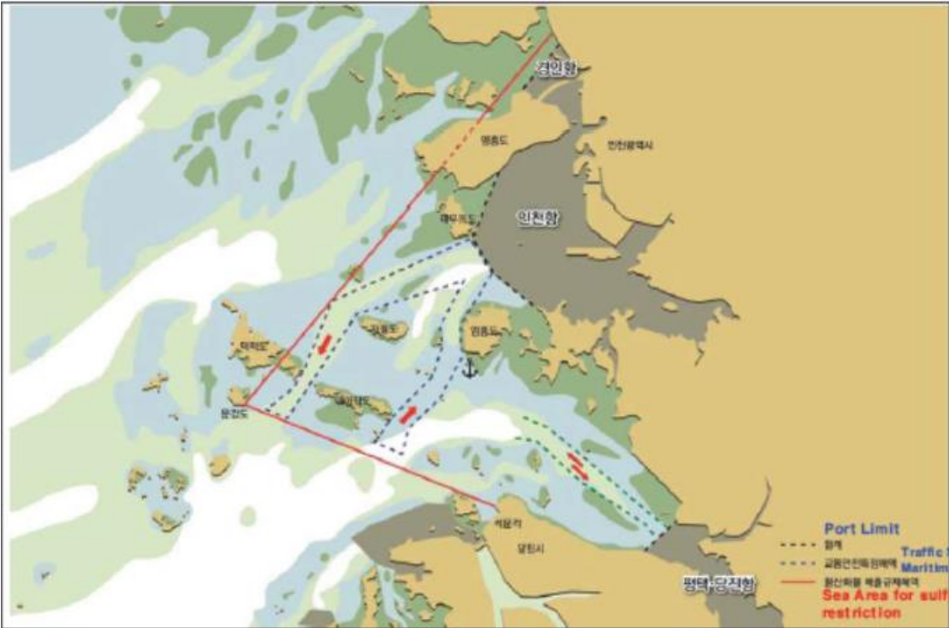
Incheon, Pyongtaek, Dangjin port